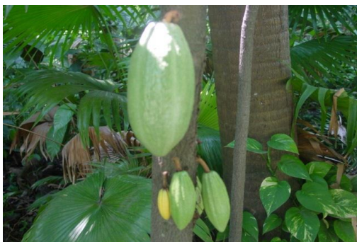
Cultivo del Cacao/ Proyectos Productivos GRL- ONUDD/UNOPS.