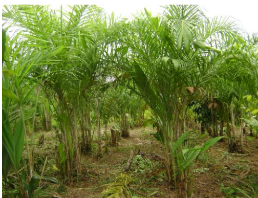
Cultivo del Pijuayo-Palmito/ Proyectos Productivos GRL- ONUDD/UNOPS.