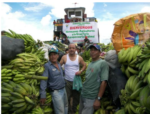
Proyecto “Mejoramiento del Sistema de Transporte y Comercialización de productos agropecuarios de las cuencas de los ríos Amazonas, Ucayali y Marañón de la Región Loreto”