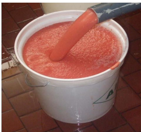
Promoción para el desarrollo de mercado regional del Camú Camú; Convenio GRL con el Instituto de Camú Camú