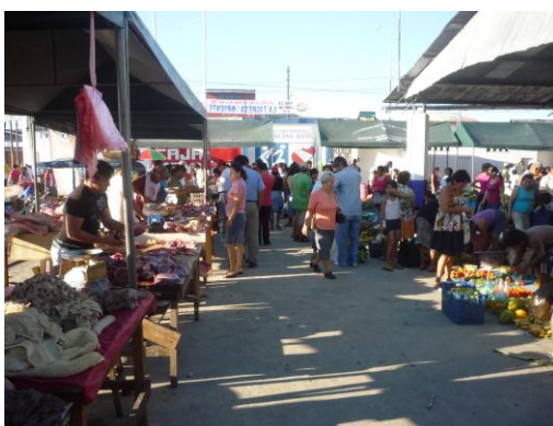
Ferias agropecuarias sabatinas en el Complejo del C.N.I., en apoyo a los productores de las cuencas